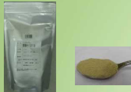
インスタントティー煎茶H1218 500g 3,550円(参考価格)