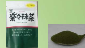
楽々抹茶(チャック袋) 40g 500円(参考価格)