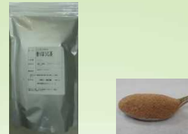
インスタントティー香りほうじ茶 500g 4,200円(参考価格)